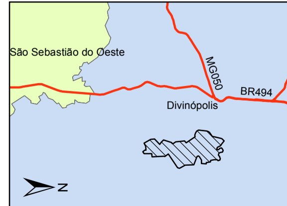
Localização da Área de Estudo